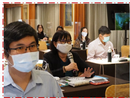
บรรยากาศในห้องจัดงาน