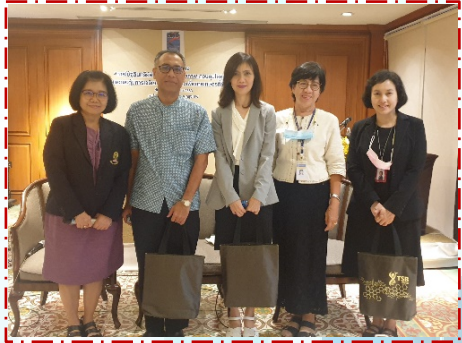
ศ.ดร.วัฒนาลัย ศ.ดร. ศิริรัตน์ และวิทยากร