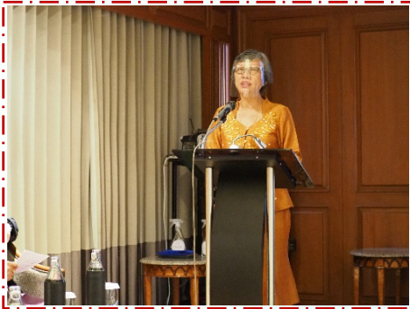
นายกสมาคมฯ กล่าวต้อนรับและกล่าวเปิดงานงาน