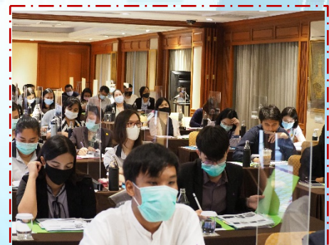
บรรยากาศในห้องจัดงาน

สมาคมฯ จัดการอบรมเชิงปฏิบัติการเรื่อง การใช้จุลินทรีย์สำหรับผลิตปุ๋ยชีวภาพ ควบคุมโรคพืช และกระตุ้นการเจริญเติบโตของพืชเพื่อการเกษตรที่ยั่งยืน วันที่ 28 ตุลาคม 2563 ณ โรงแรมเดอะ สุกโศกล ถนนศรีอยุธยา กรุงเทพฯ