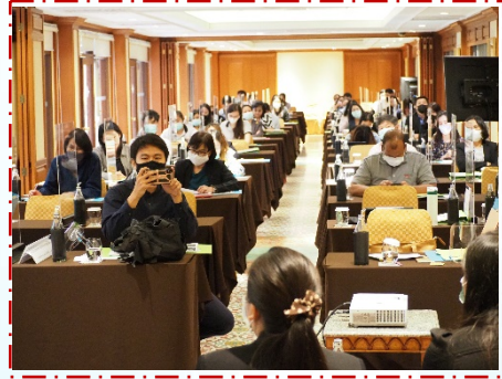
บรรยากาศในห้องจัดงาน